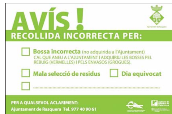
Figura 3. Adhesivo utilizado en las inspecciones del sistema de pago por generación en Rasquera. El adhesivo utilizado en Miravet es análogo

Si bien el sistema está aún en fase de consolidación, el modelo de pago por generación implantado en ambos municipios goza de buena aceptación y los resultados provisionales indican que han aumentado significativamente los niveles de recogida selectiva.